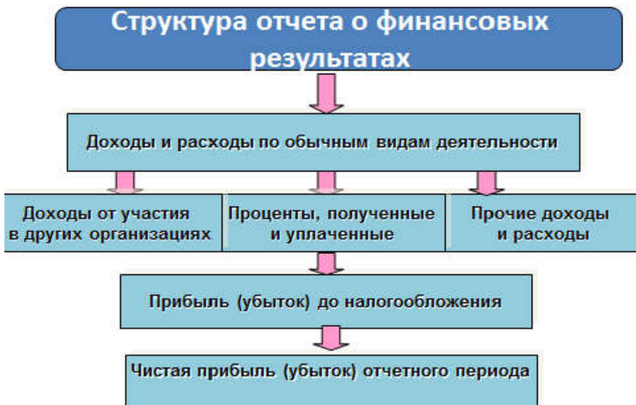
Рис. 4.1 Структура отчёта о финансовых результатах

На рисунке 4.1 представлена структура отчёта о финансовых результатах.