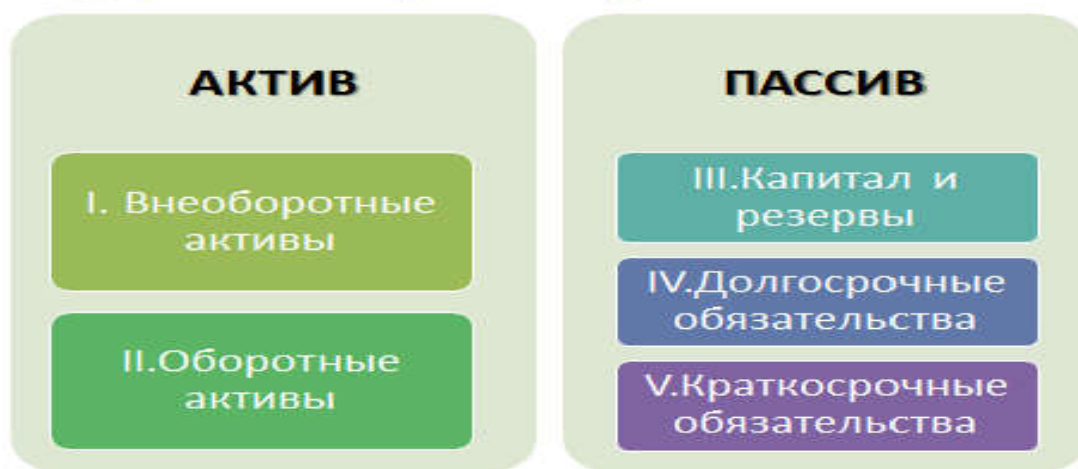
Рис. 3.1 Содержание бухгалтерского баланса

В бухгалтерском балансе активы и обязательства должны отражаться с подразделением в зависимости от срока обращения (погашения) на краткосрочные и долгосрочные. Активы и обязательства отражаются как краткосрочные, если срок обращения (погашения) по ним не более 12 месяцев после отчетной даты или продолжительности операционного цикла, если он превышает 12 месяцев. Все остальные активы и обязательства отражаются как долгосрочные.